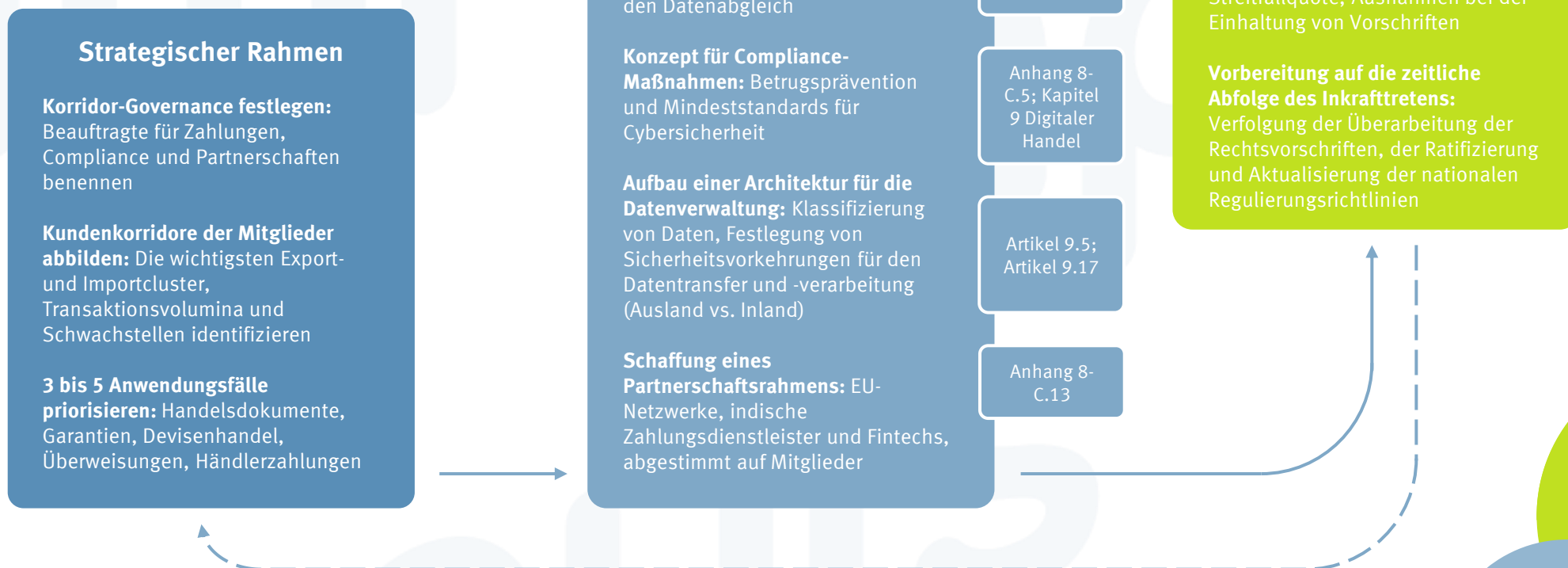
Abbildung 2: Leitfaden zur Umsetzung für Genossenschaftsbanken

Unser praktischer Leitfaden umfasst neun Schritte, die in drei Phasen gegliedert sind: strategische Rahmung, Ressourcenaufbau und Umsetzung. Abbildung 2 fasst diese Schritte zusammen und verknüpft zentrale Maßnahmen mit den entsprechenden Vertragsbestimmungen. Außerdem wird die zentrale Rolle des Ressourcenaufbaus hervorgehoben und eine Rückkopplungsschleife integriert, durch die Ergebnisse aus Pilotprojekten und regulatorische Entwicklungen in iterative Anpassungen einfließen.